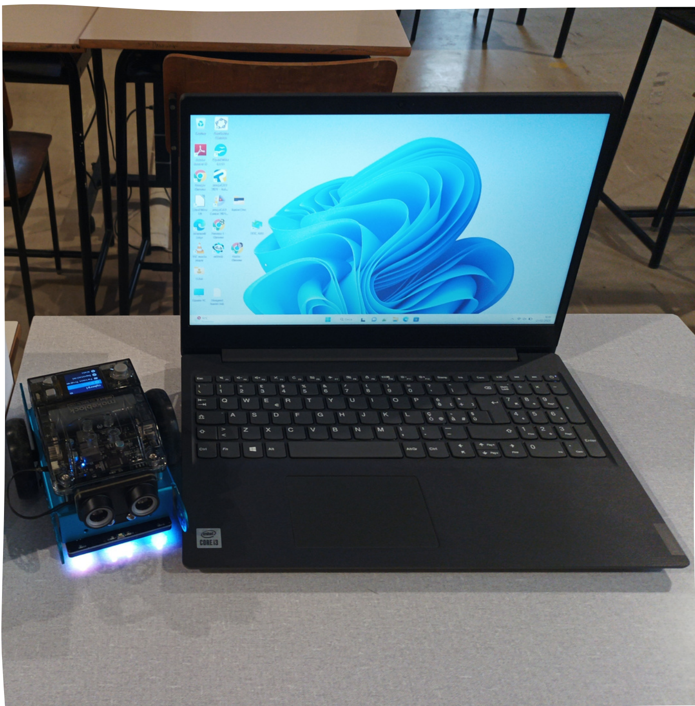
1 Un robot assemblato e pronto per l'utilizzo